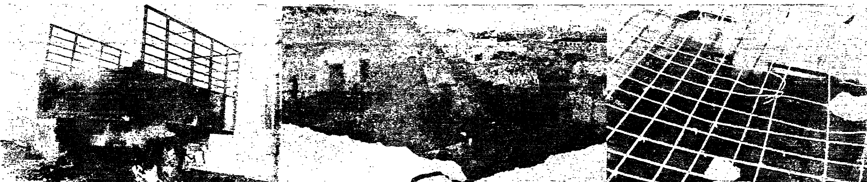
القطر مصور الدستور وتسميم التصوير في الجيش و « فلوطي » الجبهة من صور العدوان الاسرائيلي الفاعل على القرى الاثرية الاثنية اثناء طول يوم أمس . وتبدو في الصورة الاولى مدرسة ام قيس وقد ذهبت اقبال بسقيها . وفي الثانية مجموعة من القتلى التي هدمها العدوان الجبان . وفي الثالثة عربة تراكور تشتمل فيها التيران

تبادل المدفعية الثقيلة تمثل جبهة تمتد ٣٠ كيلومترا واستمر أكثر من ٧ ساعات كعادة الجيش العربي الاردني الهاسل في رده على كل عدوان اسرائيلي ، كان رده بالامس على الاعتداء فاعلا ومؤثرا ، كيد العدو ضلنا فإدخه في افراده ومعداته واسلحته ، اعترف العدو بدموعها واضطر الى اخفاء البعض الآخر . ولقد شمل الاعتداء الاسرائيلي طول وجهاة الاردن الشمالية واستمر أكثر من سبع ساعات ونقيا يلي نصوص البلاغات العسكرية الاردنية مرتبة حسب تسلسل صدورها :